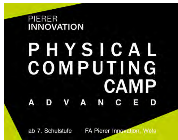
Pierer Innovation Physical Computing Camp – Advanced