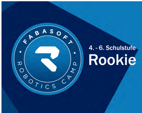
Fabasoft Robotics Camp – Rookie