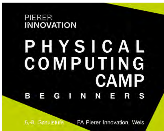
Pierer Innovation Physical Computing Camp – Beginners