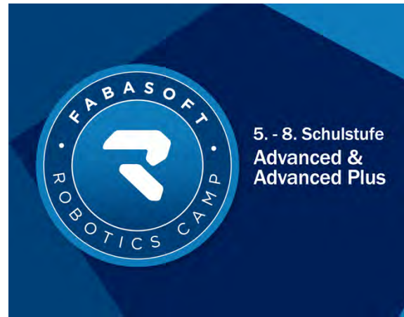
Fabasoft Robotics Camp - Advanced & Advanced Plus